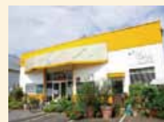
ケーズデンキ白井パワフル館隣り